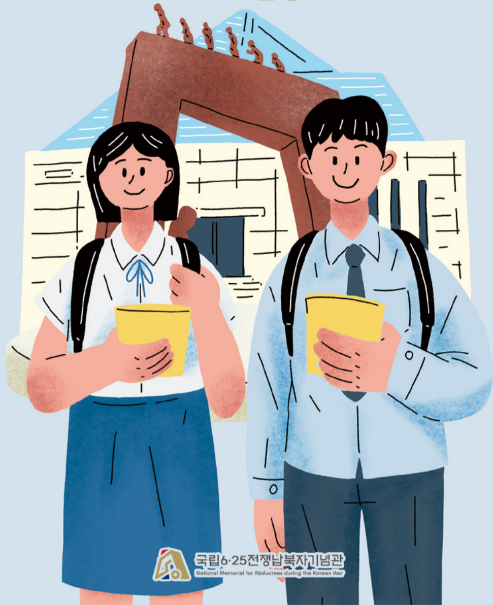
국립6·25전쟁납북자기념관 National Memorial for Abductees during the Korean War